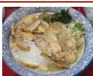
黒あさりラーメン：1,100円 (限定)

私製はがきを使用して年賀状を出す場合にも、 はがきの表面に赤い文字で「年賀」と記してあれば、同様に52円 で出すことができます。「年賀」と書いてなければ通常はがきの扱いになりますので気を付けて下さいね！（なお、 喪中 はがきに関しては通常はがきと同じ 62円 となります。） というわけで、年賀状を出す際は皆様ご注意ください。なお、年賀状は12月25日までに投函すると確実に元旦に届くそうですよ！お早めにご準備を！そしてぜひ、年賀状印刷は高橋写真製版にて、よろしくお願いいたします！ ※詳しくは裏面に