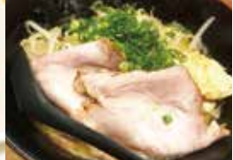
新 鶏白湯 X (950円)

圧倒的支持を得る鶏白湯 風変わりな店名と奇抜な限定麺も目立つが、レギュラーメニューニューがしつかり美味い。