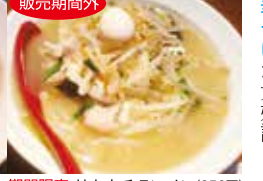
期間限定 サカウチタンメン(850円)

母娘で営み10周年 塩ラーメンは、高熱にうなされている日でもお粥代わりに食べられるんじゃないかというくらいに優しい口当たり。生姜中華そばが大好評。