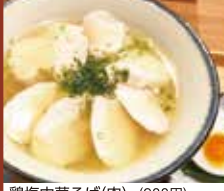
鶏塩中華そば(肉) (900円)

青葉区上杉 1丁目 4-30 上杉サショウビル 1F 営業時間 11:00 ~ 21:00 定休日 日曜