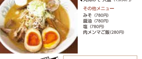
◀丸得みそ大盛 (1,030円) その他メニュー みそ (780円) 醤油 (780円) 塩 (780円) 肉メンマご飯(280円)

生姜入り味噌でポカポカ オードックスな見た目ながらチャーシューも玉子もしっかりと味がついてる。生姜も主張しすぎず程よい。