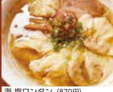
海 塩ワンタン (870円)

太白区東郡山 2丁目 49-32 営業時間 11:30 ~ 14:30 定休日 火曜・第3水曜