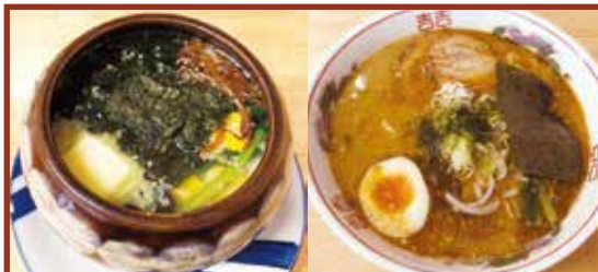
▲壺塩ラーメン…1,000円 ▲のうこくみそラーメン…800円

SUSTAINABLE DEVELOPMENT GOALS 世界を変えるための17の目標