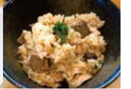
ゴロゴロ焼豚の炊き込みご飯 (200円)

無化調ラーメンとゴロゴロ炊き込みご飯 具沢山の炊き込みご飯は、個人的にナンバーワン。