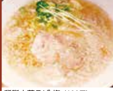
背脂中華そば 塩 (680円)

若林区若林 6丁目 1-10 営業時間 11:00 ~ 14:30 17:30 ~ 20:00 土・日・祝 11:00 ~ 16:00 定休日 月曜・第4火曜