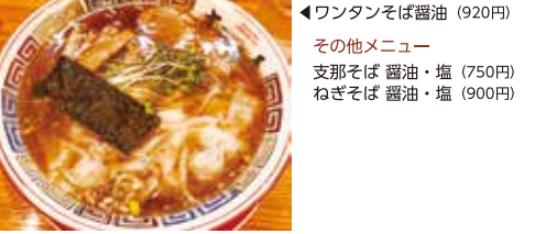
◀ワンタンそば醤油 (920円) その他メニュー 支那そば 醤油・塩 (750円) ねぎそば 醤油・塩 (900円)

東京の名店の味を駅前 本店店主は気仙沼出身で、半熟煮卵の生みの親と言われている。正に一醬油ラーメン食ったなあ」となる味。