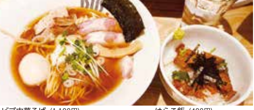
ビブ中華そば (1,100円) はらこ飯 (400円)

今、話題の新店! 歯ごたえある細麺が特徴。夜遅くまで営業しているのもありがたい。