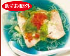
期間限定 マリンブルーの風を抱かれて ~2020 夏 (900円)

青葉区八幡 1丁目 4-26 営業時間 11:30 ~ 14:30 17:30 ~ 21:30 (土日午後の部は 17:00 ~ 21:00) 定休日 火曜・第4月曜