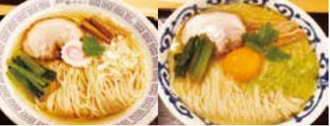
本枯節支那そば 大盛 (880円) 鶏白湯 塩 (850円)

本枯節を使った芸術麺 多賀城の名店として知られ、近年は五橋でお屋のみ営業していた桜木製麺所が、大和町にて待望の夜営業。鶏白湯も復活!