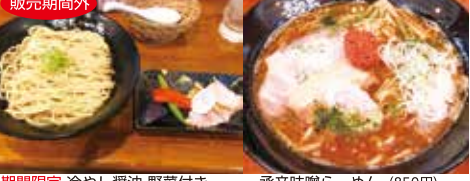
期間限定 冷やし醤油 野菜付き (900円) 一丞味噌噌らーめん (850円)

玄龍の場所と業を受継ぐ さわら出汁の店 モールに移転した名店玄龍で修行。味噌もさることながら限定の冷やし醤油が絶品。添えられている野菜も美味!