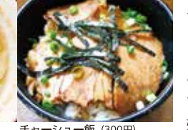
チャーシュー飯 (300円)

海・山・トマト! 焼きあごだしの海と、動物性背脂の山の二通りのスープがあり。さらにそれぞれ塩と醤油から選ぶことができる。トマトらーめんも好評。