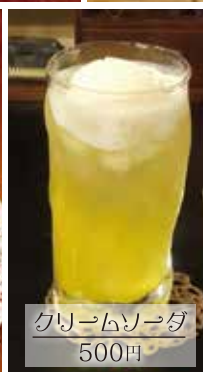
クリームソーダ 500円