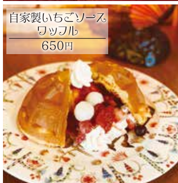
自家製いちごソース ワッフル 650円