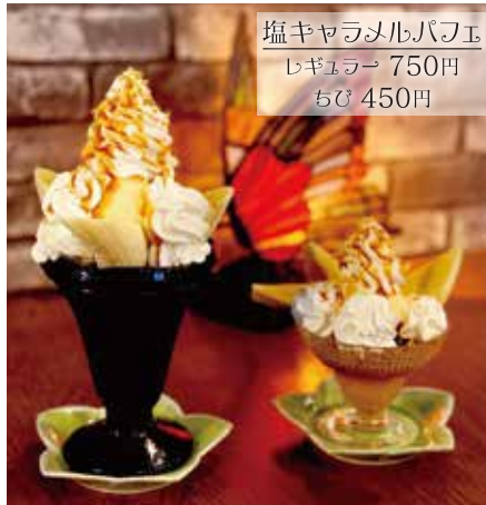
塩キャラメルパフェ レギュラー 750円 ちび 450円