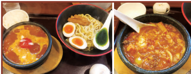
▲SPまるごとトマトつけ麺(メのチーズリゾット付)1,000円 ▲ご飯とチーズを入れてリゾットに

SUSTAINABLE DEVELOPMENT GOALS 世界を変えるための17の目標