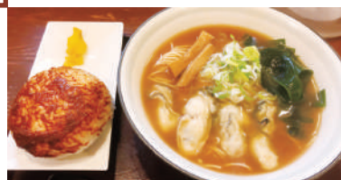
▲11月限定 極上生牡蠣中華1,100円 味噌おにぎり180円

イタリアン薫る中山の人気店 券売機に節系豚骨やパワー系中華など、見えないボタンが並ぶ中今回チョイスしたのはトマトつけ麺。石鍋の中でつけ汁がグツグツを音を立てながら運ばれてくる。真ん中の赤い球はミニトマトかと思いきや大きなトマトが丸ごと。 あさりや海老の旨味とトマトの酸味のバランスが見事なスープに、バジルソースを絡めた麺を浸けていただく。一時は正に至福メはチーズリゾットとしても楽しめる満足感でいっぱい이다。 味噌おにぎりは大ボリュームでラーメンによく合う。